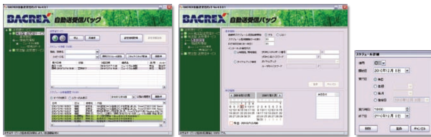
■自動送受信スケジュール稼働履歴画面

受注者が導入しているBACREX受注型サーバとEDIを行うお得意先のパソコン、またはPCサーバにインストールします。発注型と同様に、設定スケジュールにより自動送信・自動受信が行えます。送受信結果により後続プログラムを起動する機能もあります。この機能を利用すれば、基幹システムで作成したデータをフォーマット変換してから送信、その結果を基幹システムに通知するといった緊密な連携も可能です。(送信前処理用プログラムや後続プログラムは別途開発が必要)